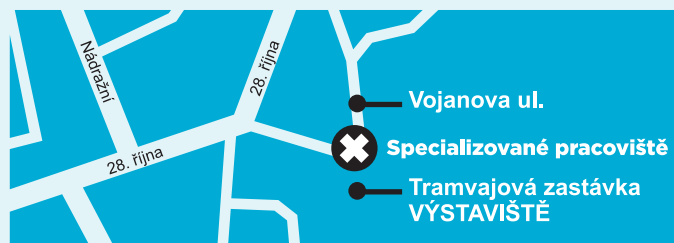
Orientační mapa s umístěním Specializovaného pracoviště na Vojanově ul.

Po, St: 8:00-16:30 h Út, Čt, Pá: 8:00-15:00 h