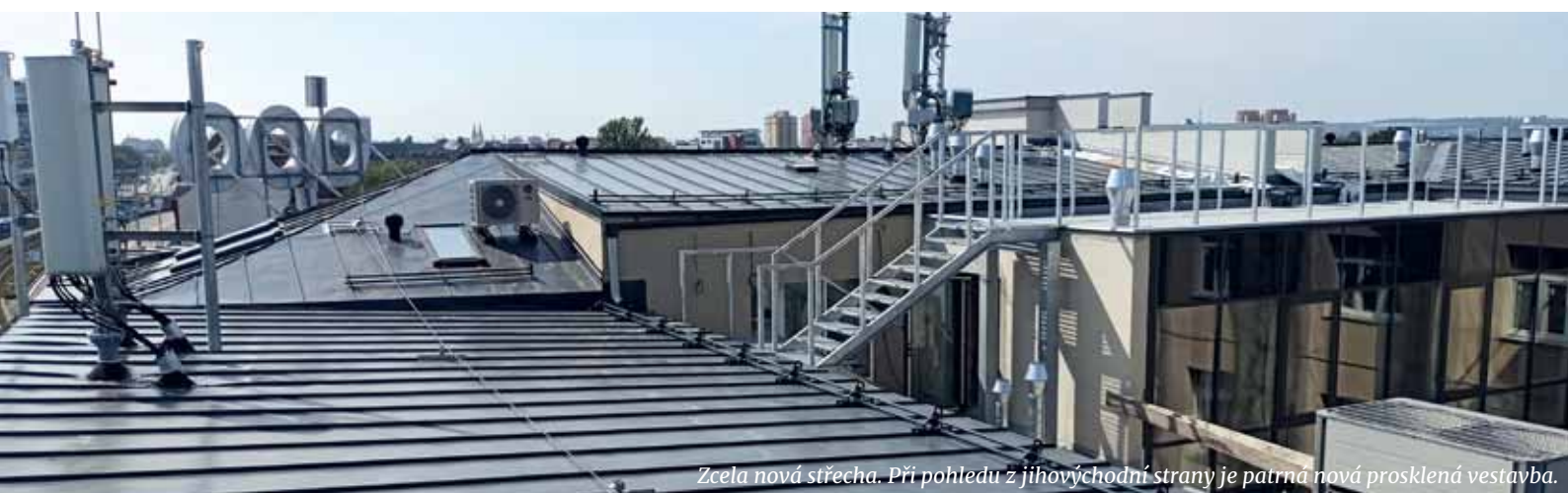
Zcela nová střecha. Při pohledu z jihovýchodní strany je patrná nová prosklená vestavba.