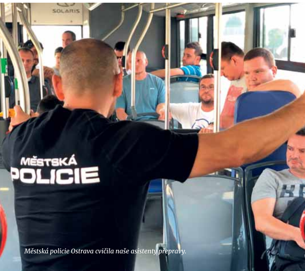
Městská policie Ostrava cvičila naše asistenty přepravy.