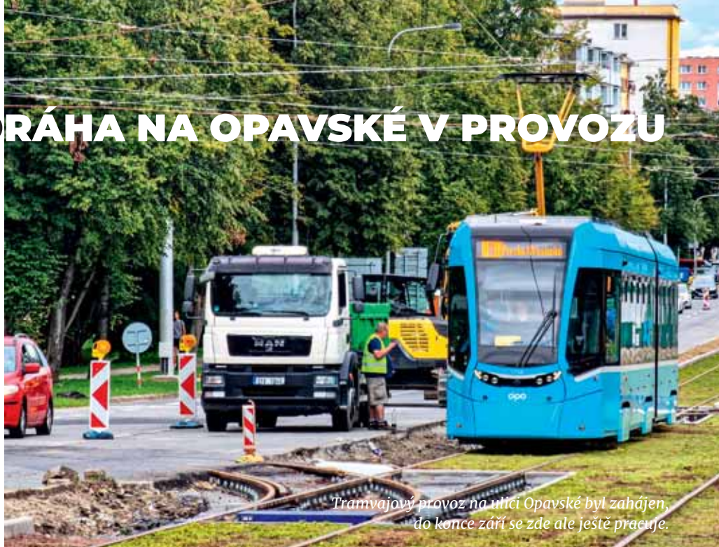
Tramvajový provoz na ulici Opavské byl zahájen, do konce září se zde ale ještě pracuje.