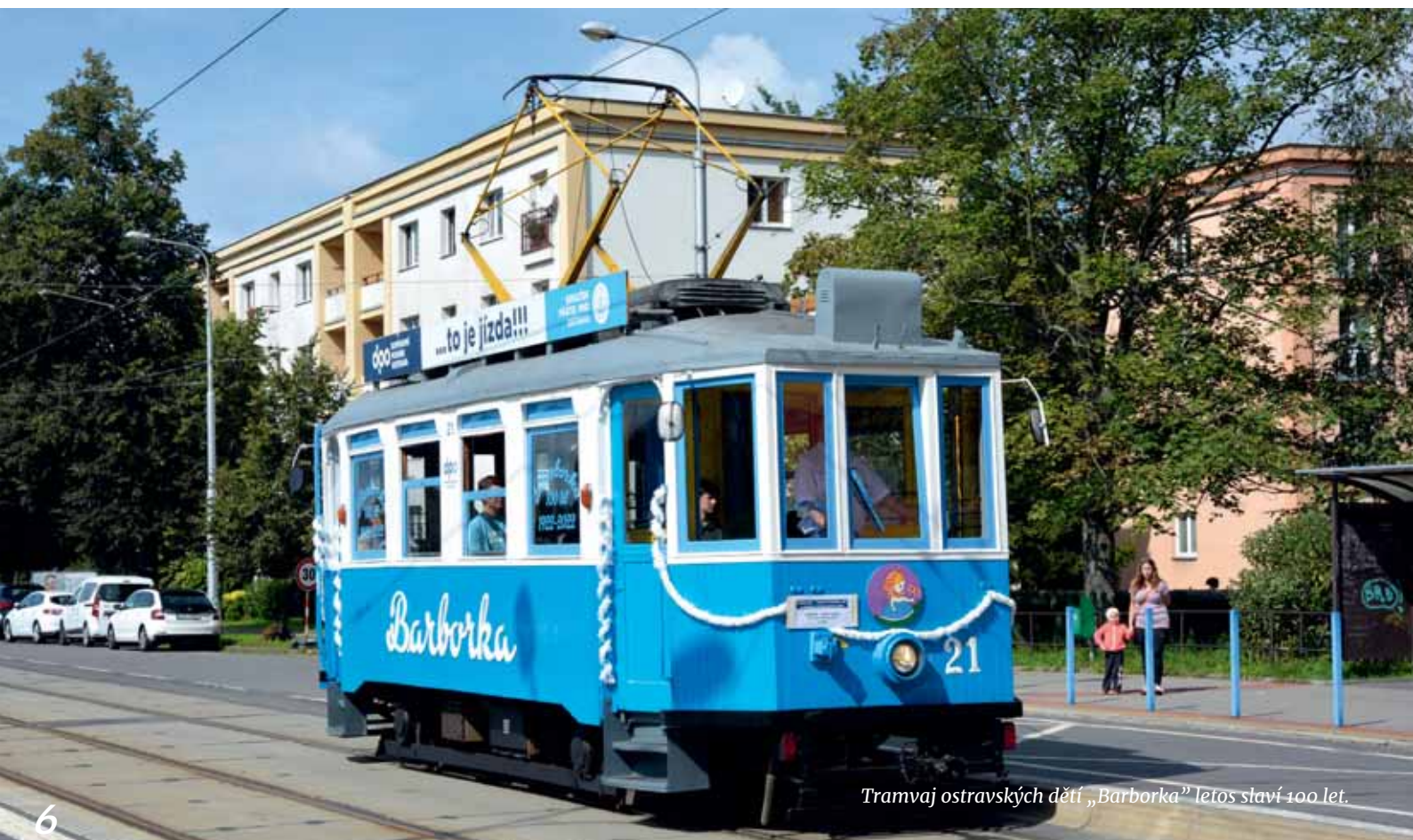
Tramvaj ostravských dětí „Barborka“ letos slaví 100 let.