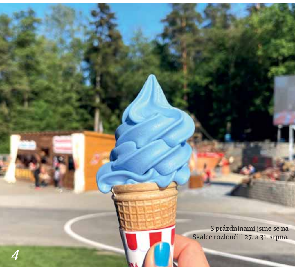
S prázdninami jsme se na Skalce rozloučili 27. a 31. srpna.

Na jaře jste si oslavy Dne dětí na Skalce pořádně užili. Proto jsme na konec léta přichystali jako přídavek ještě další dva dny. Volné vstupy pro naše zaměstnance a jejich děti do Skalka family parku byly tentokrát v sobotu 27. a středu 31. srpna.