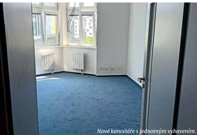
Nové kanceláře s jednotným vybavením.