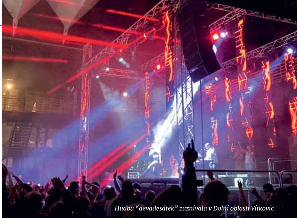
Hudba „devadesátek“ zaznívala v Dolní oblasti Vítkovic.