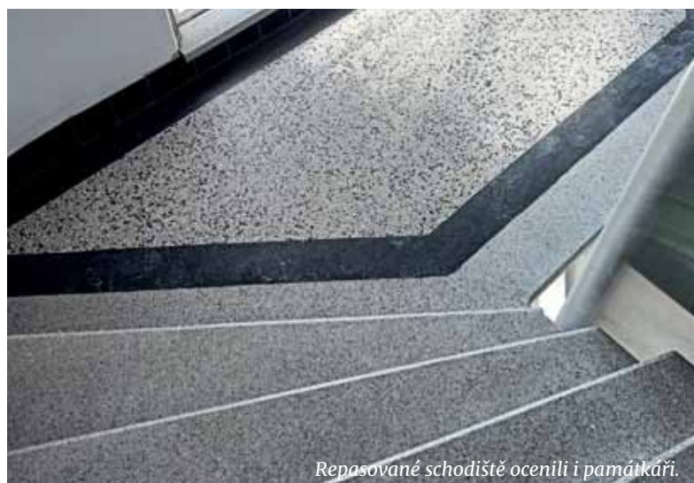
Repasované schodiště ocenili i památkáři.