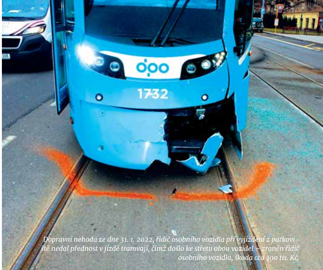
Dopravní nehoda ze dne 31. 1. 2022, řidič osobního vozidla při vyjíždění z parkoviště nedal přednost v jízdě tramvaji, čímž došlo ke střetu obou vozidel – zraněn řidič osobního vozidla, škoda cca 300 tis. Kč.

aji a náhle vešel do jejího jízdního koridoru. Hlavní a stále se opakující příčinou vzniku dopravní nehody z vlastní viny řidiče MHD byla v prvním pololetí letošního roku opět chyba při ovládání vozidla, tj. neodhadnutí jízdního profilu v celkem 63 případech. O druhé místo se dělí nevěnování se řízení a nedání přednosti v jízdě – po sedmi případech.