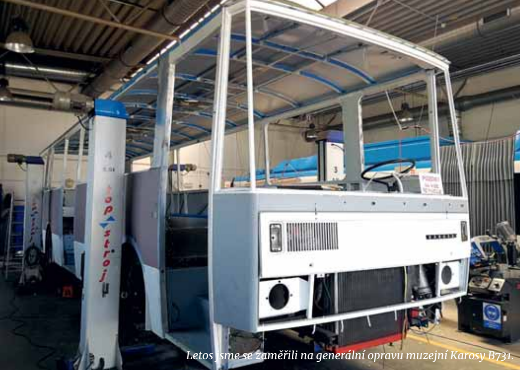
Letos jsme se zaměřili na generální opravu muzejní Karosy B731.

Dopravní podnik ve svém depozitáři eviduje několik zajímavých exemplářů historických autobusů, které dokumentují přepravu cestujících ve 20. a na počátku 21. století. Snažíme se je udržet v provozuschopném stavu, a tak všechny potřebují pravidelnou údržbu a čas od času rozsáhlejší opravu.