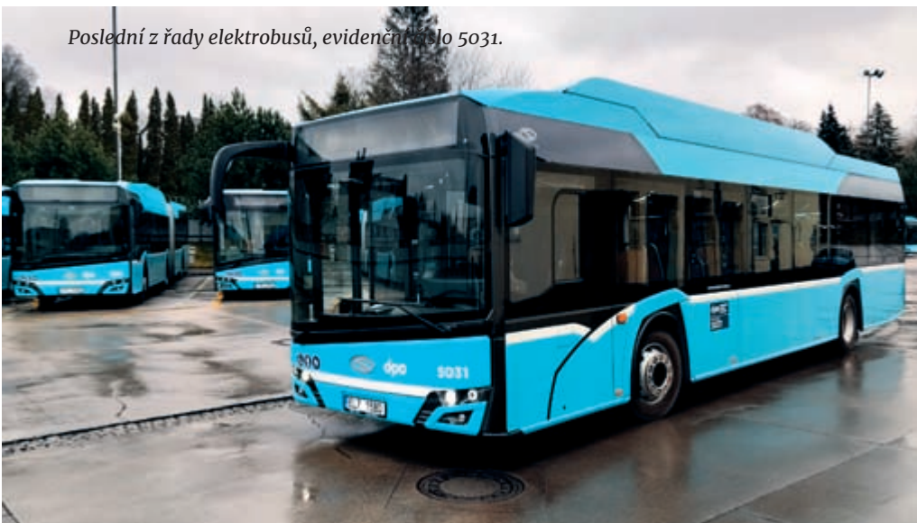
Poslední z řady elektrobusů, evidenční číslo 5031.

přičemž větší část nákladů pokryje dotace Evropské unie.