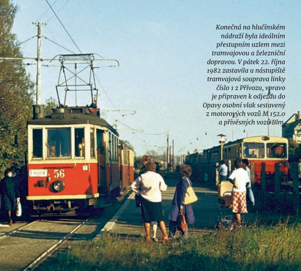
Konečná na hlučinském nádraží byla ideálním přestupním uzlem mezi tramvajovou a železniční dopravou. V pátek 22. října 1982 zastavila u nástupiště tramvajová souprava linky číslo 1 z Přívozu, vpravo je připraven k odjezdu do Opavy osobní vlak sestavený z motorových vozů M 152.0 a přívěsných vozů BIm

Letos jsme oslavili významné výročí týkající se trolejbusové dopravy, a to 70 let od zahájení provozu na prvních dvou trolejbusových linkách. Také tramvajová doprava má letos svá výročí, ta se však netýkájí rozvoje, nýbrž rušení.