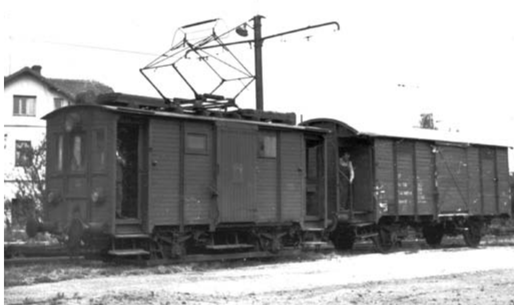
Nákladní motorový vůz číslo 106 přistavuje k vykládce na nádraží v Klimkovicích zavřený železniční vůz řady Zt. Snímek byl pořízen v posledních letech existence nákladní kolejové dopravy DPMO.