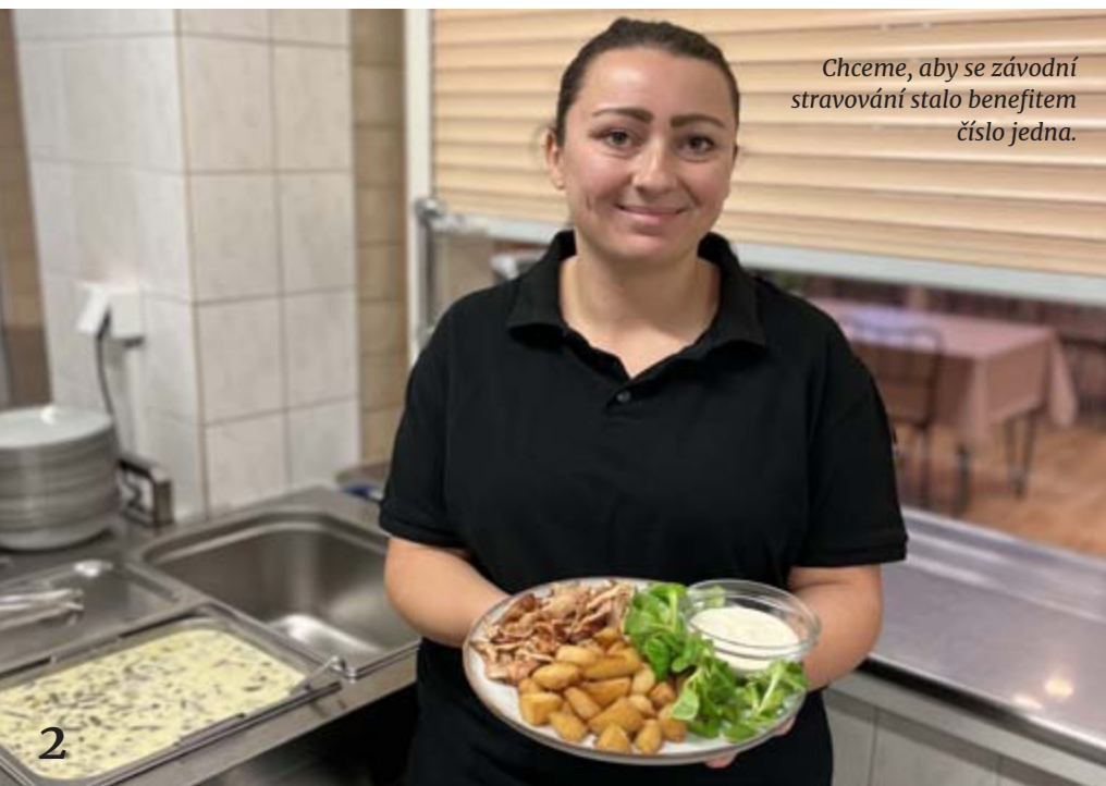
Chceme, aby se závodní stravování stalo benefitem číslo jedna.