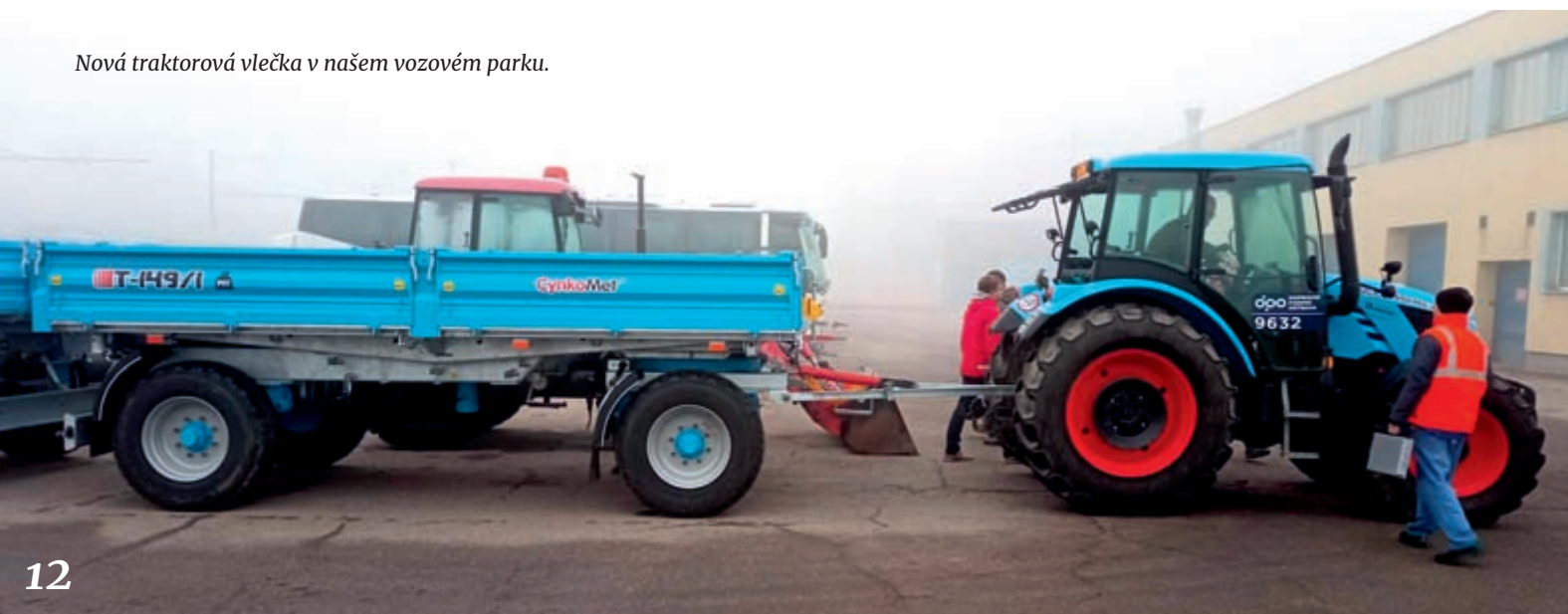
Nová traktorová vlečka v našem vozovém parku.