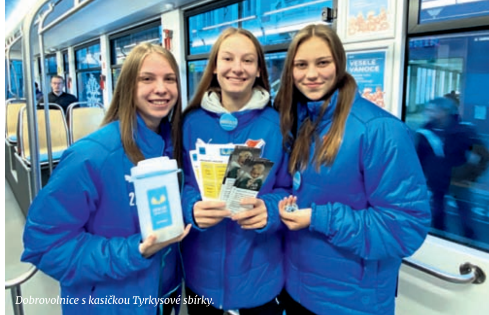
Dobrovolnice s kasičkou Tyryksové sbírky.

„Děkujeme všem, kteří se letos do Tyryksové sbírky zapojili. Těší nás a vážíme si toho, že i v dnešní nelehké době jste našli prostor pomáhat potřebným. Letošní 5. ročník Tyryksové sbírky odstartovala jízda naší vánoční tramvají, která bude v provozu i nadále a doufáme, že i vy se její jízdou potěšíte,“