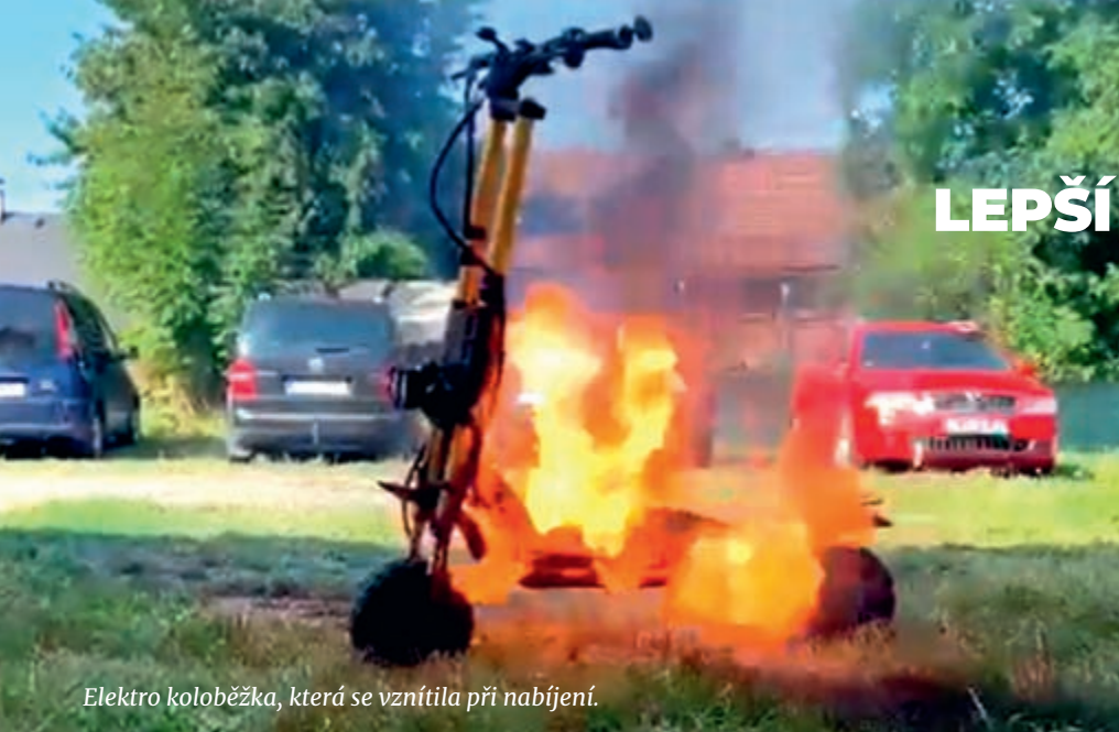
Elektro koloběžka, která se vznítla při nabíjení.