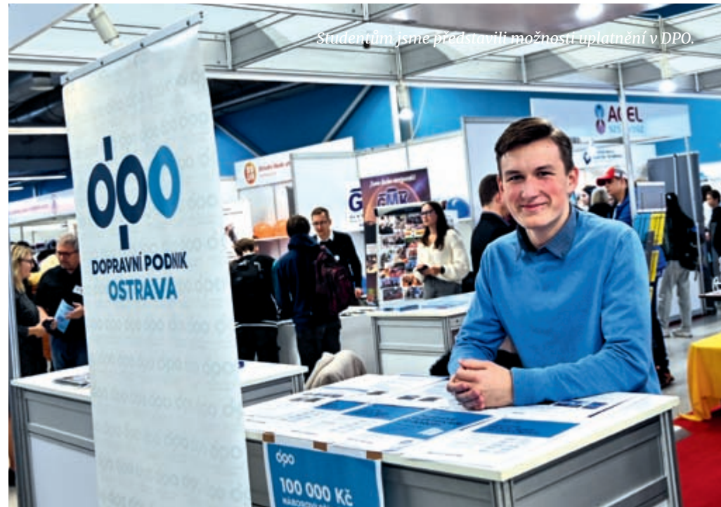
Studentům jsme představili možnosti uplatnění v DPO.