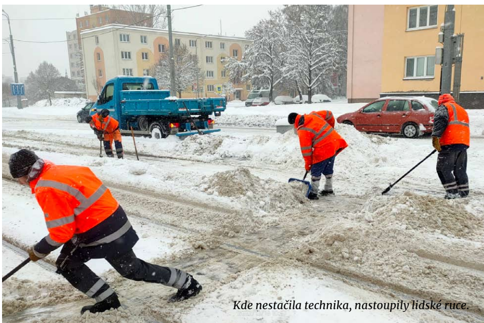
Kde nestačila technika, nastoupily lidské ruce.