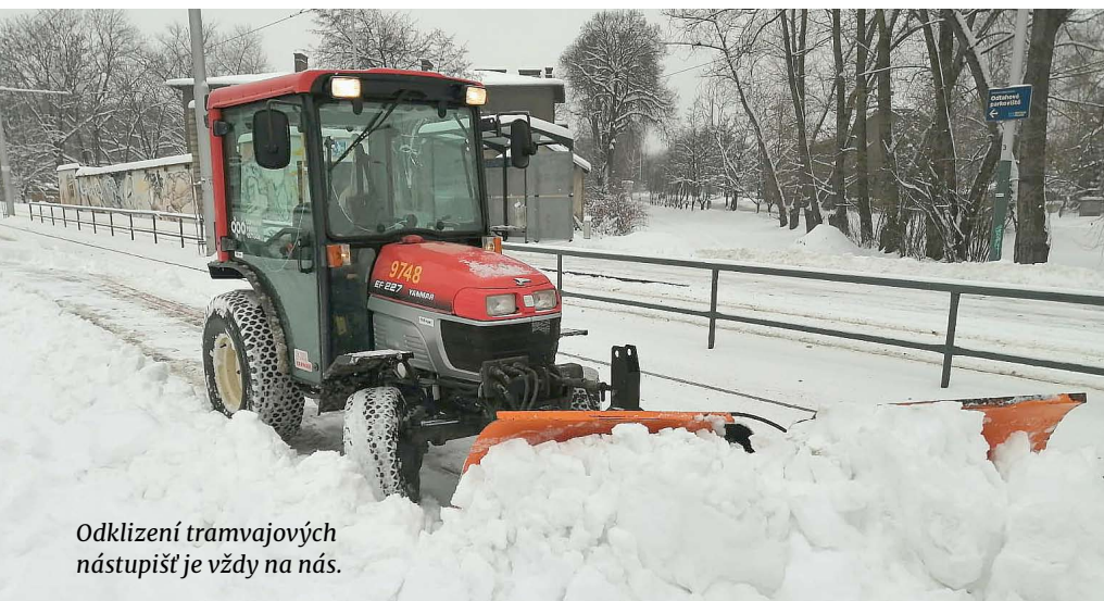
Odklizení tramvajových nástupišť je vždy na nás.

V pátek 16. prosince potrápilo husté sněžení celý region. Obzvláště pak cestující v Ostravě a dopraváky.