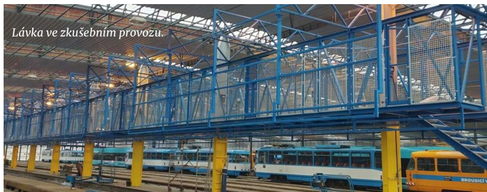
Lávka ve zkušebním provozu.

Nové tramvajové vlaky mají většinu technologie umístěnou na střeše vozů. Musíme k ní zajistit kvalitní a bezpečný přístup pro údržbu a opravy.