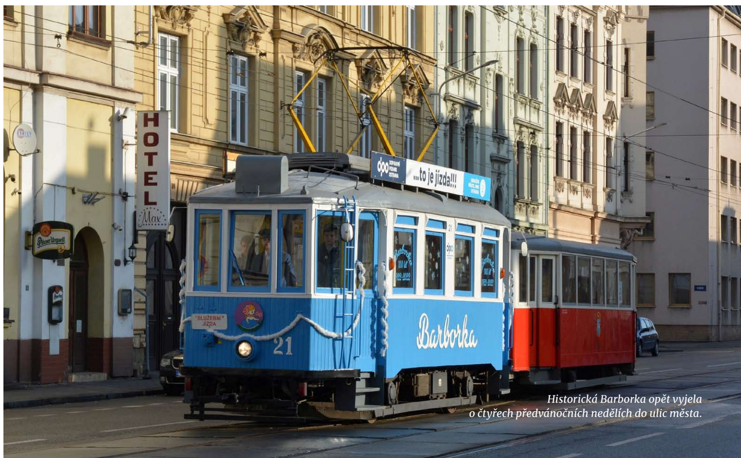
Historická Barborka opět vyjela o čtyřech předvánočních nedělích do ulic města.