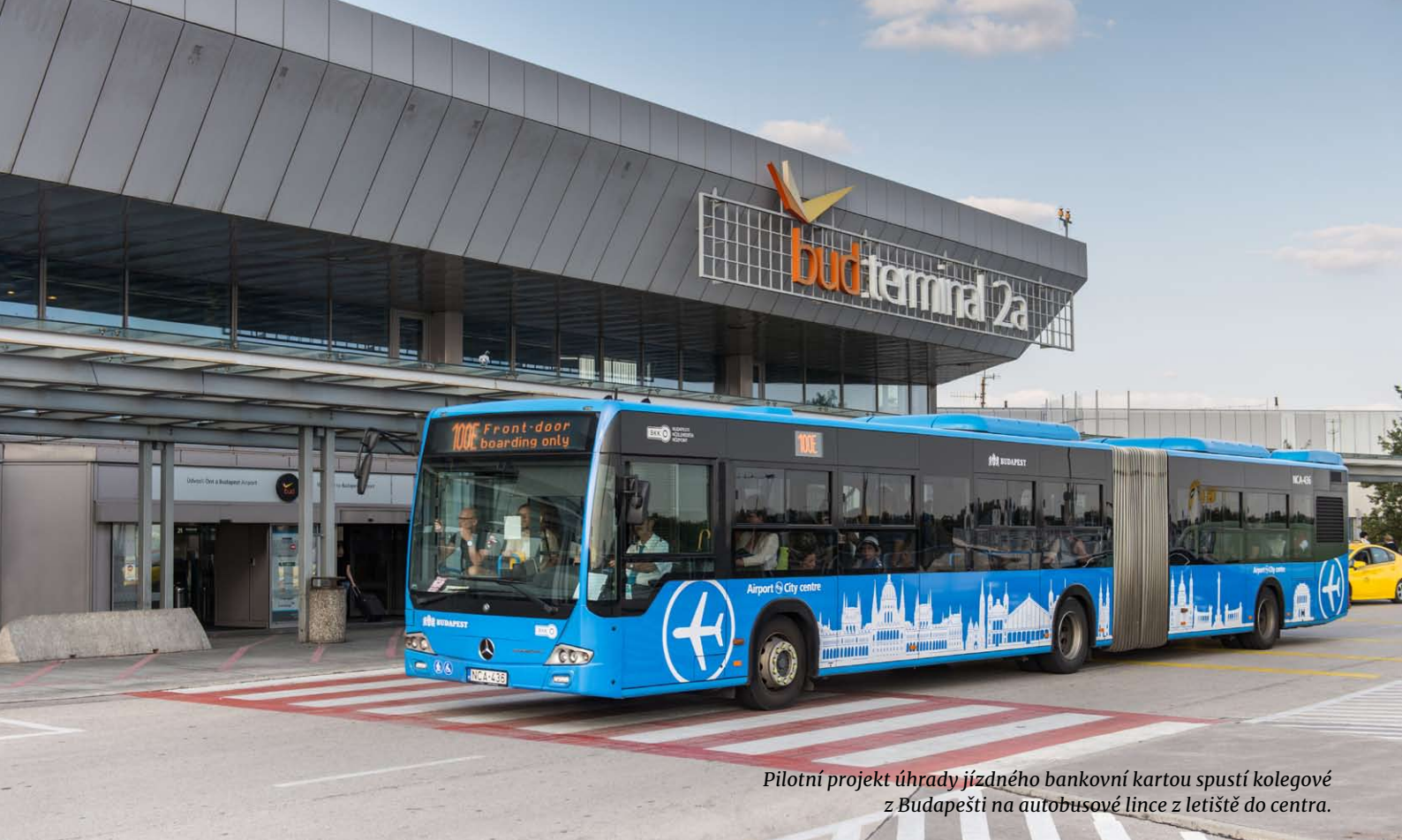
Pilotní projekt úhrady jízdného bankovní kartou spustí kolegové z Budapešti na autobusové lince z letiště do centra.