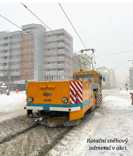
Rotační sněhový odmetač v akci.