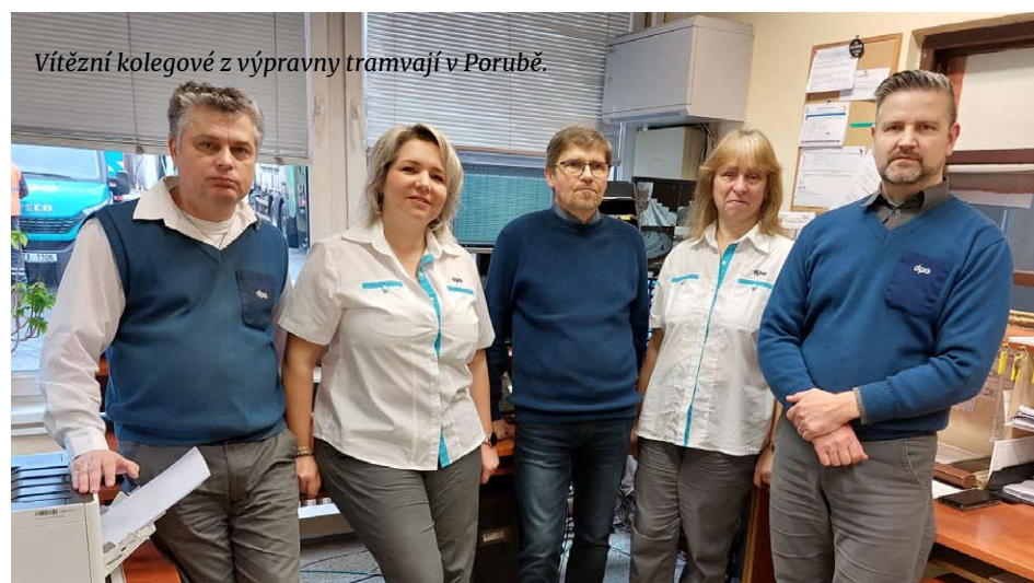
Vítězní kolegové z výpravy tramvají v Porubě.