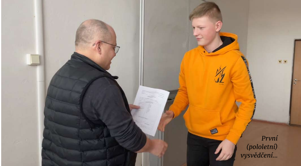
První (pololetní) vysvědčení...