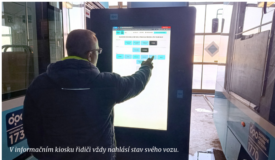
V informačním kiosku řidiči vždy nahlásí stav svého vozu.

V průběhu listopadu testovali aplikaci Elektronická kniha závad (EKZ) řidiči all track. Testování proběhlo velmi úspěšně a nic nebránilo tomu, abychom od 1. prosince spustili aplikaci EKZ do ostrého provozu.