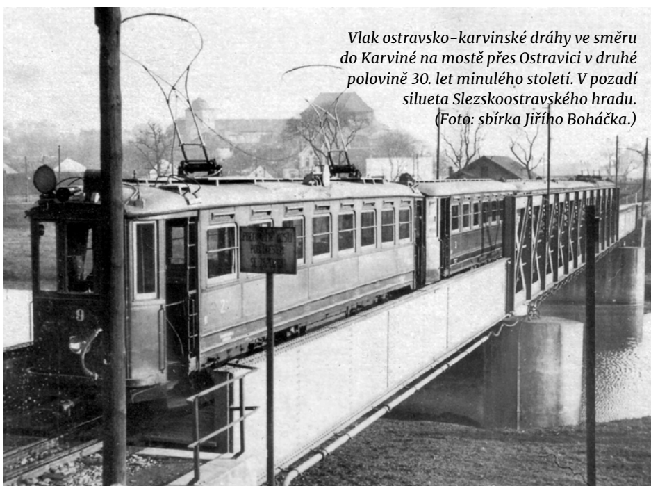
Vlak ostravsko-karvinské dráhy ve směru do Karviné na mostě přes Ostravici v druhé polovině 30. let minulého století. V pozadí silueta Slezskoostavského hradu.

Další úzkorozchodnou dráhou v regionu představuje místní dráha Hrušov – Polská Ostrava. Osobní doprava zde byla zahájena na začátku roku 1904, a to s parními motorovými vozy odlišné konstrukce než v Bohumíně. Hlavním úkolem dráhy však byla doprava uhlí z Dolu Trojice do hrušovské továrny na sodu a na překladiště severní dráhy v Hrušově. Také této dráze se nevyhnula elektrizace, která proběhla v roce 1911.