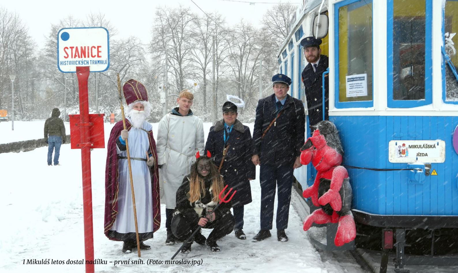
I Mikuláš letos dostal nadílku – první sních.