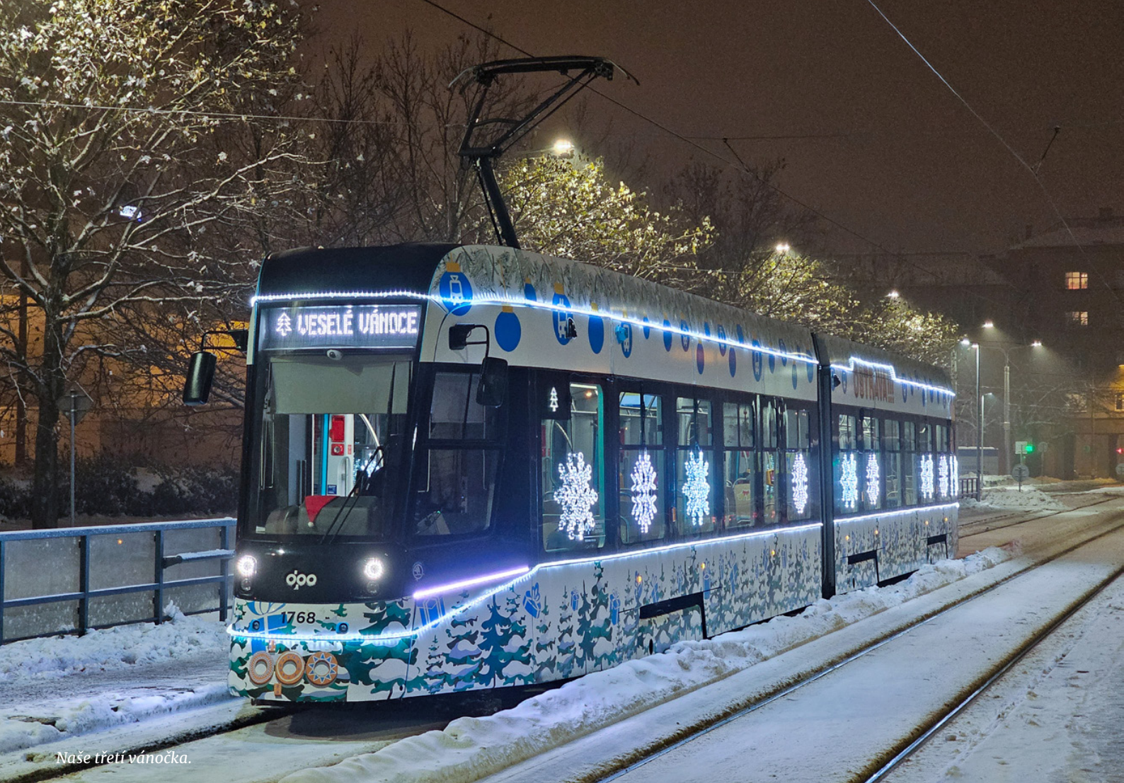
Naše třetí vánočka.