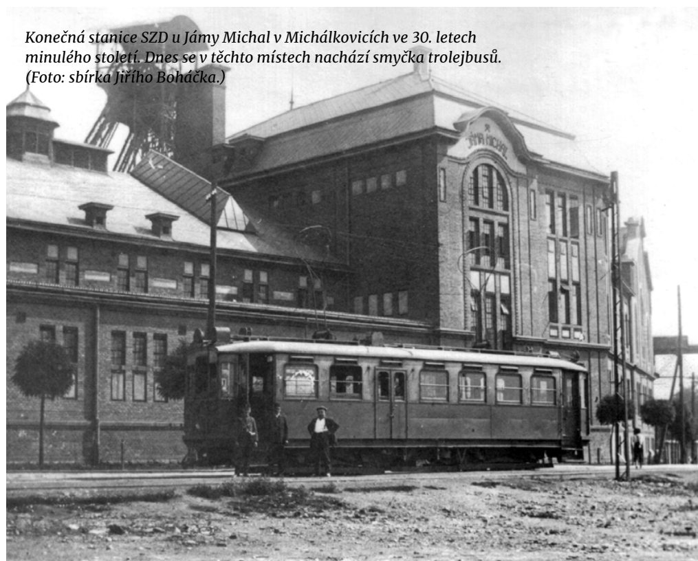
Konečná stanice SZD u Jámy Michal v Michálkovicích ve 30. letech minulého století. Dnes se v těchto místech nachází smyčka trolejbusů.

Po spojení drah do jednoho podniku ještě krátkou dobu probíhal určitý rozvoj, například v říjnu 1950 byla prodloužena trať od Sýkorova mostu na nové úzkorozchodné nádraží na Smetanově náměstí a v lednu 1951 byla provedena přeložka koncového úseku tratě ve Fryštátě. Poslední větší stavbou v celém úzkorozchodném systému bylo prodloužení tratě z Karviné OÚNZ na novou konečnou Karviná Stalingrad v roce 1953. Právě tento rok lze bez nadsázky nazvat vrcholným obdobím úzkorozchodných drah, neboť již v roce 1954 byla zahájena postupná likvidace této sítě, která trvala bezmála 20 let. Bohužel se začaly výrazně projevovat nevýhody celého systému, jako jednokolejné tratě s výhybnami,