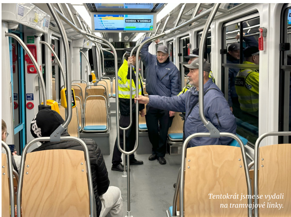
Tentokrát jsme se vydali na tramvajové linky.