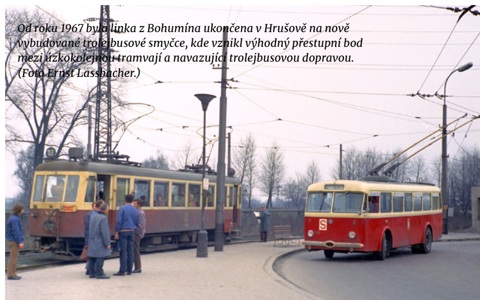
Od roku 1967 byla linka z Bohumína ukončena v Hrušově na nově vybudované trolejbusové smyčce, kde vznikl výhodný přestupní bod mezi úzkokolejnou tramvají a navazující trolejbusovou dopravou.

Smetanovo náměstí – Hranečník, v roce 1960 odjela poslední úzkorozchodná tramvaj z Moravské Ostravy a o rok později z Karviné 1. Postupně tak došlo