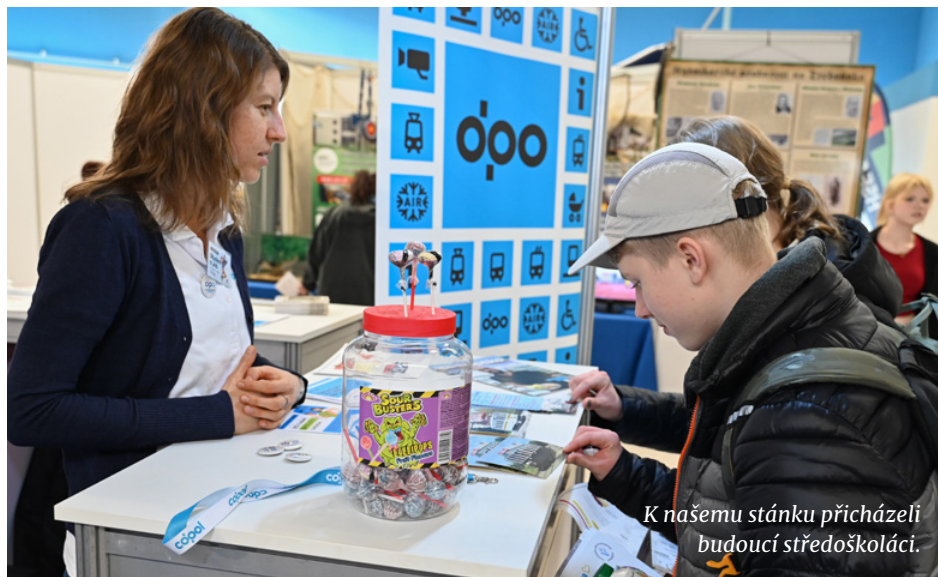
K našemu stánku přicházeli budoucí středoškoláci.

V pátek a v sobotu 24. a 25. listopadu jsme se spolu s naší partnerskou Střední školou technickou a dopravní z Ostravy-Vítkovic (SŠTD) prezentovali na veletrhu Student a Job na Černé louce.