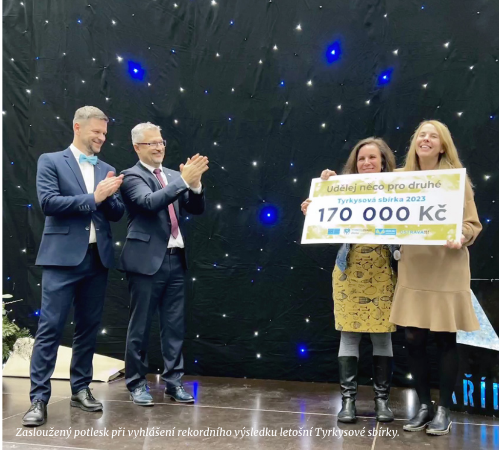
Zasloužený potlesk při vyhlášení rekordního výsledku letošní Tyrkysové sbírky.

Ani tento ročník sbírky se neobešel bez tyrkysových DOBROt. Naši zaměstnanci přinesli 20. listopadu své kulinářské výtvary, které byly po celý den, resp. do snědení zásob, k zakoupení pro všechny mlsné kolegyně a kolegy. Až do 24. listopadu probíhal DOBRObazárek, v němž zaměstnanci nabídli věci, které jim již neslouží, ale mohou stále dělat radost v novém domově. Finance