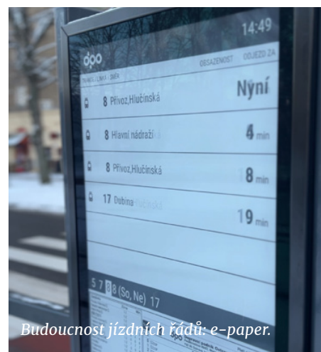
Budoucnost jízdních řádů: e-paper.