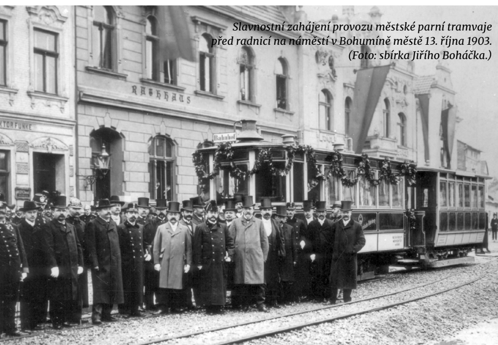
Slavnostní zahájení provozu městské parní tramvaje před radnicí na náměstí v Bohumíně městě 13. října 1903.

Uvedený stav trval v podstatě až do roku 1938, kdy došlo k územnímu rozdělení MDOK a SZD na části nacházející se ve zbytkovém Československu (později Protektorátu) a na části v zabraném území. Po osvobození v roce 1945 se rozdělené dráhy opět spojily, další změna nastala v roce 1947, kdy SZD převzaly Městskou elektrickou dráhu Bohumín. Zásadní změna však přišla v roce 1949, kdy obě zbývající společnosti