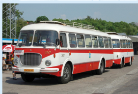
LINKOVÝ AUTOBUS ŠKODA 706 RTO CAR ČÍSLO 247 S PŘÍVĚSEM JELCZ PO 1E ČÍSLO 1227 „erták“ a „jelčák“

Výrobce: autobus Karosa národní podnik, Vysoké Mýto · přívěs Jelczańskie Zakłady Samochodowe, Jelcz k/Oławy, Polska Rzeczpospolita Ludowa