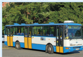
MĚSTSKÝ AUTOBUS KAROSA IRISBUS B 952E ČÍSLO 6563 „irisbus“

V roce 1982 obdržel ostravský dopravní podnik první autobusy nového typu Karosa B 731. Vedle hranaté karoserie s výklopnými dveřmi bylo zásadním rozdílem oproti vozům ŠM 11 umístění hnacích agregátů za zadní nápravou. Do roku 1991 bylo pořízeno 226 těchto vozů, poslední autobus B 731 byl vyřazen v roce 2006. Kromě toho bylo v Ostravě v provozu dalších 218 autobusů odvozeného typu B 732 s manuální převodkou.