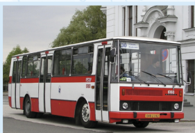
MĚSTSKÝ AUTOBUS KAROSA B 731 ČÍSLO 6160 „dodoš“

Od roku 1967 byl ostravský autobusový park doplňován koncepčně moderními městskými vozy Karosa ŠM 11 s třídvéřovou samonosnou panelovou karoserií, automatickou dvoustupňovou převodkou, agregáty umístěnými pod podlahou ve střední části vozu a vypružením vzduchovými vlnovci. Jejich dodávky byly ukončeny v roce 1981, kdy celkový počet zařazených vozů dosáhl 441 kusů. V provozu se udržely do roku 1990.