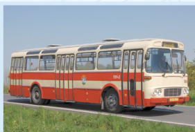
MĚSTSKÝ AUTOBUS KAROSA ŠM 11 ČÍSLO 5842 „ešemka“

Po ukončení výroby autobusů Škoda 706 RO pokračovaly od roku 1959 dodávky inovovaným typem Škoda 706 RTO. Do r. 1975 bylo zařazeno do provozu, včetně 23 licenčních Jelcz MEX 272E, 282 těchto autobusů. Ke zdolávání přepravních nároků byly v letech 1965 - 1975 dodávány z Polska přívěsy Jelcz PO 1E v celkovém počtu 72 kusů. Provoz „ertáků“ byl ukončen v roce 1984, přívěsů o tři roky dříve.