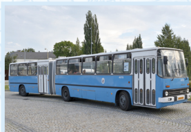
ČLÁNKOVÝ LINKOVÝ AUTOBUS IKARUS 280.10 ČÍSLO 4070 „ikarus, čabajka“

Přímým pokračovatelem autobusů produktové řady Karosa 700 se stala řada 900. Došlo k zakulacení obou čel, montáži velkoplošného čelního skla a dalším menším inovacím. Do Ostravy bylo dodáno mezi lety 1997 až 2001 celkem 60 vozů typu B 932 a 932E a dále v rozmezí let 2002 až 2006 dalších 46 autobusů B 952 a 952E, u nichž byl použit motor Iveco Cursor splňující normu Euro 3. Poslední vozy B 932E byly staženy z linek MHD v roce 2019.