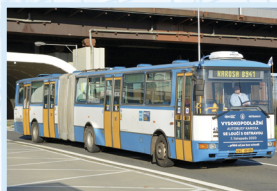
ČLÁNKOVÝ MĚSTSKÝ AUTOBUS KAROSA B 941E ČÍSLO 4285 „kloubák“

Jako náhrada autobusů s přívěsy byly pro ostravskou MHD dodávány od roku 1977 kapacitní článkové vozy Ikarus 280. Do roku 1990 bylo zařazeno do provozu celkem 102 těchto společlivých vozů, z toho 93 městských autobusů ve čtyřdvéřovém provedení a 9 dvoudvéřových linkových. Posledních 11 „čabajek“ opustilo linky DPO v roce 2000. Historický autobus číslo 4070 příslušel do garáží Hranečník a převážně byl vypravován na linky číslo 31 a 41.